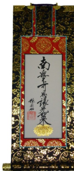
御脇掛 本金欄特製品