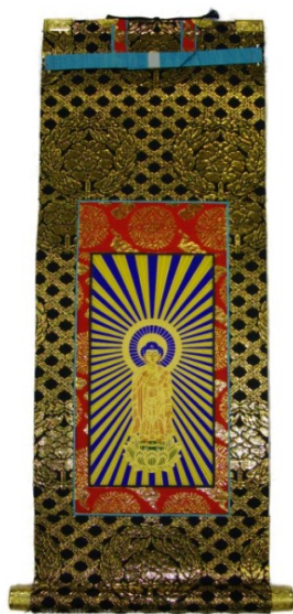
御本尊 本金欄極上品