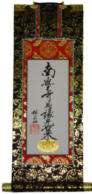
御脇掛 本金襴特製品