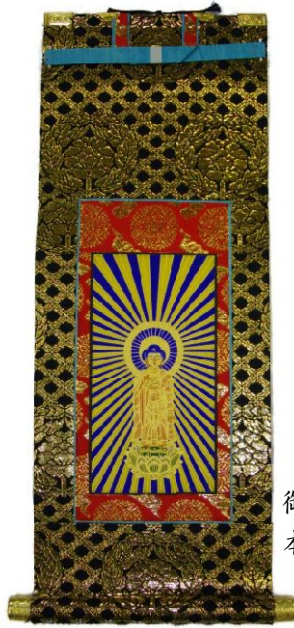
御本尊 本金襴極上品